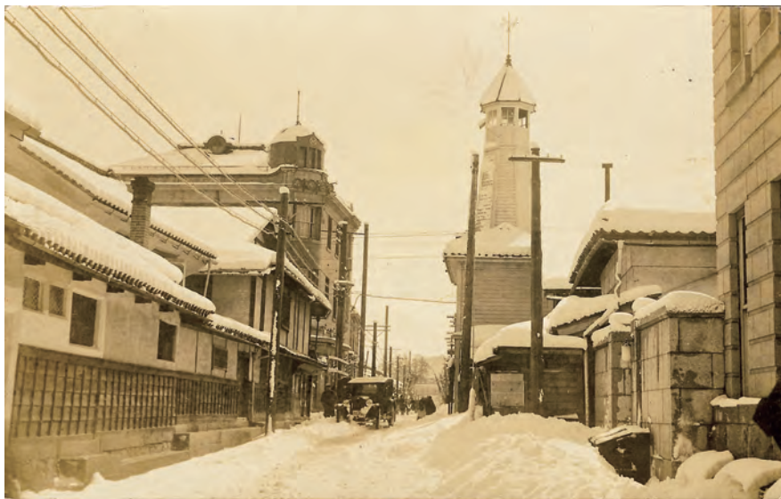
肴町と生姜町の辻にあった社屋