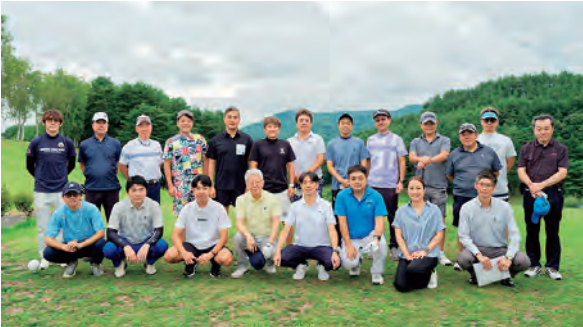
スタート前の集合写真