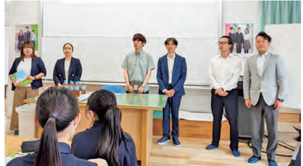
授業開始のあいさつ

開催日：令和7年7月10日（木） 会 場：盛岡中央高校附属中学校 3年生 35名 参加者：7名