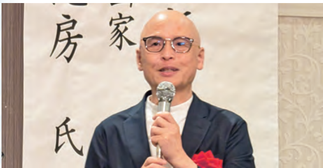
記念講演会講師「ドラゴン桜」作者の三田紀房氏