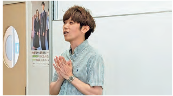
講師の長野税制委員長