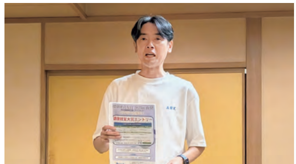
大泉部会長より今年度の活動方針についての説明