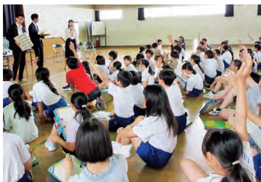
「1億円、持てたい人？」（6月23日 仙北小）