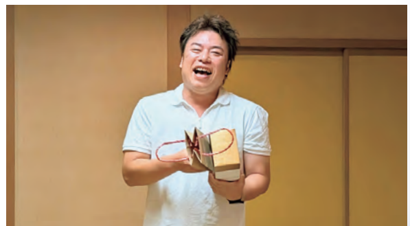
同日開催のゴルフコンペ優勝の道下研修委員長