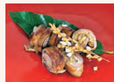
写真：茄子の豚チーズ巻