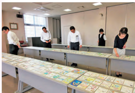
絵はがき審査会の様子（9月12日 法人会館）

授業の最後に、税に関する絵はがきコンクール募集のお知らせをしたところ、昨年度を上回る過去最高の574点の応募がありました。講師の皆さま、ご協力ありがとうございました。