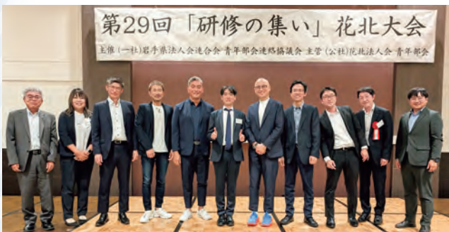
参加者全員の集合写真