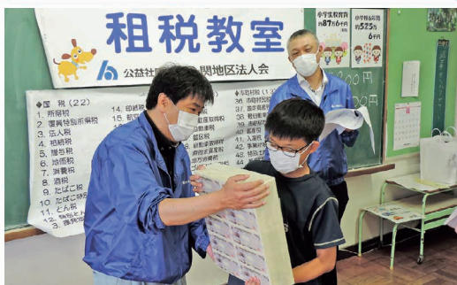
小学校での租税教室