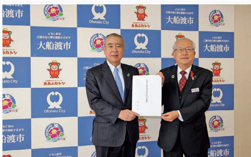
大船渡市長へ要望書提出