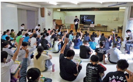
青年部会による租税教室