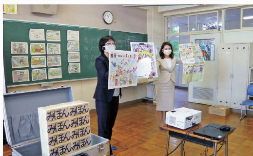
女性部会 税金出前教室