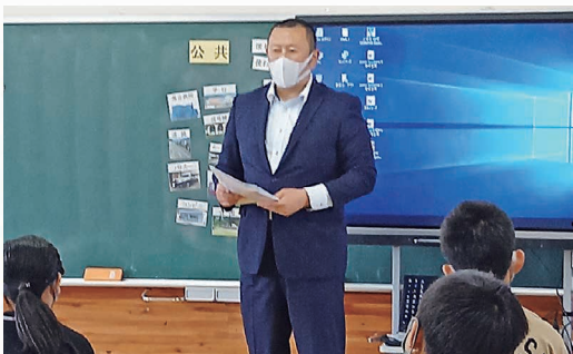
令和3年度 青年部会長講師による租税教室