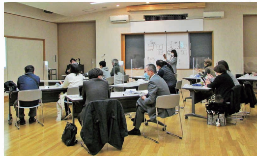
SNS活用セミナー二戸地区