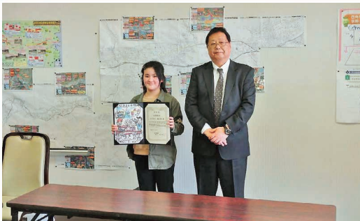
令和2年度 税に関する絵はがきコンクール表彰式