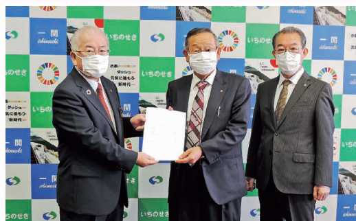
一関市長・一関市議会議長へ要望書提出