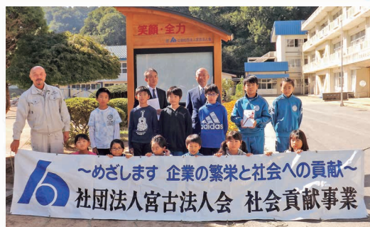
小学校へ屋外掲示板寄贈