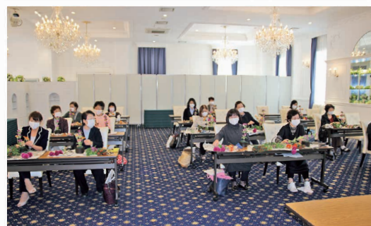
フラワーアレンジメントセミナー開催