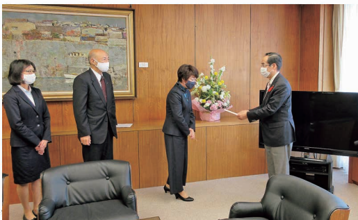
日本赤十字社北上地区長北上市長へ寄付依頼