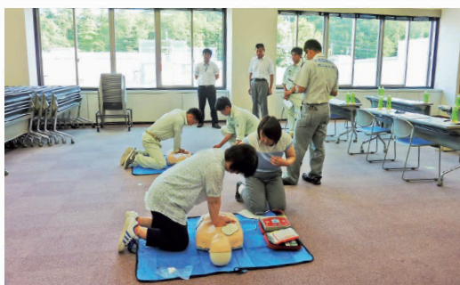
上級救命講習会の開催