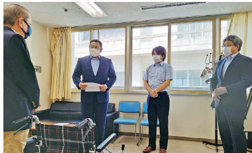
令和2年度 車椅子寄贈活動