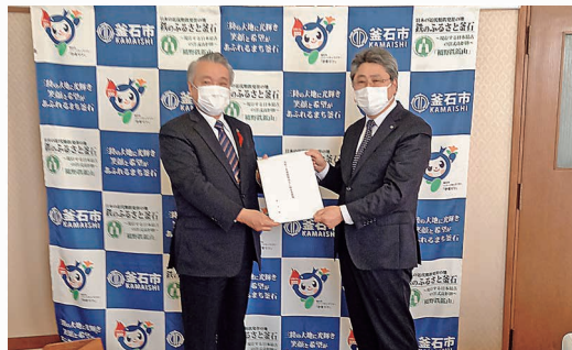
令和2年度 新里会長から釜石市長への税制提言