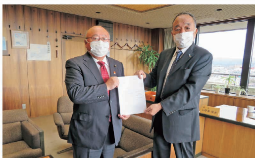
市議会議長へ提言書を提出