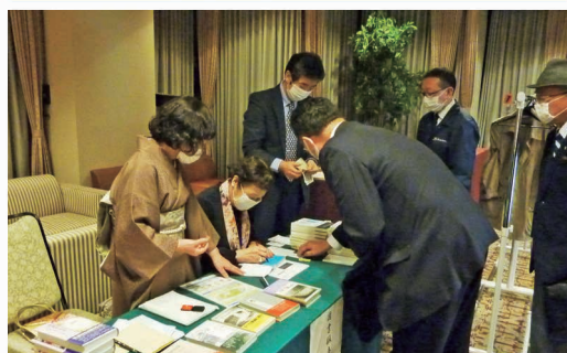
記念講演会 講師出版本サイン会