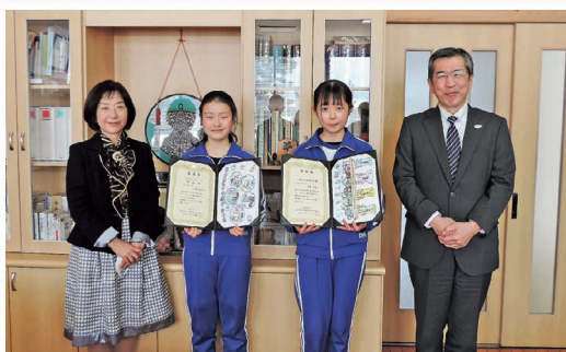
女性部会 税に関する絵はがきコンクール