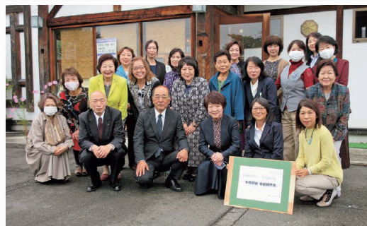
税務署長による女性部会研修会