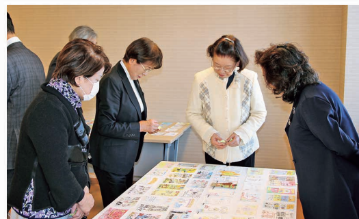
絵葉書コンクール選考会開催