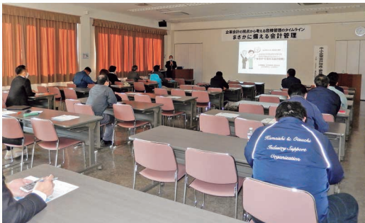
令和2年度 中小企業会計啓発・普及セミナー