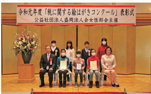
女性部会 税に関する絵はがきコンクール