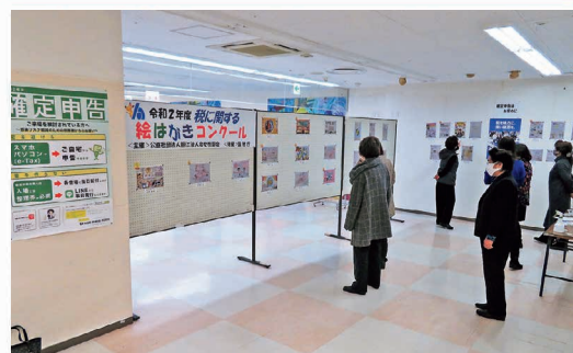
女性部会 税に関する絵はがきコンクール作品展示