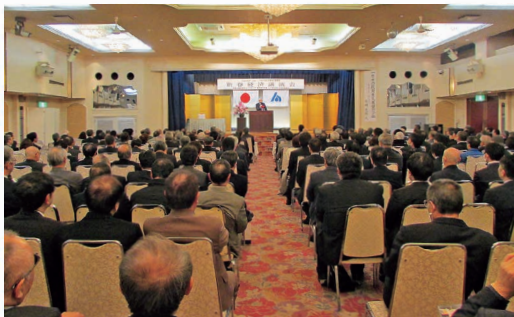
新春経済講演会の様子