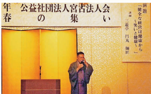
新春の集い講演会