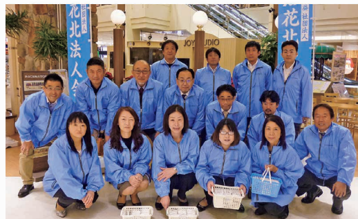
申告納税制度周知のティッシュ配り