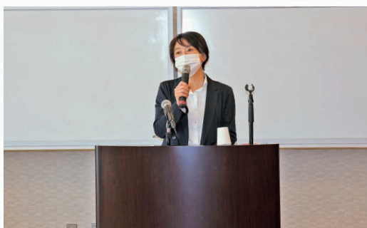
会社の決算申告の実務セミナー開催