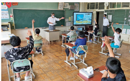
青年部会 小学校での租税教室