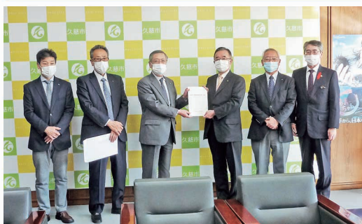
久慈市長への税制改正要望