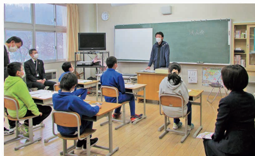
青年部会 租税教室の様子