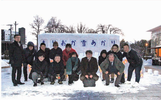
青年部会 もりおが雪あかりボランティア活動