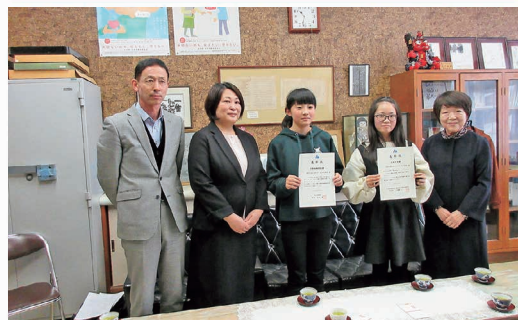
税に関する絵はがきコンクール、税務署長賞・花巻市長賞表彰