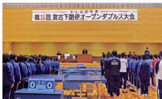
法人会杯争奪オープンダブルス卓球大会