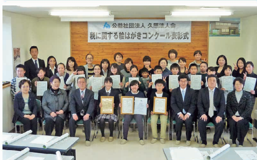
税に関する絵はがきコンクール表彰式