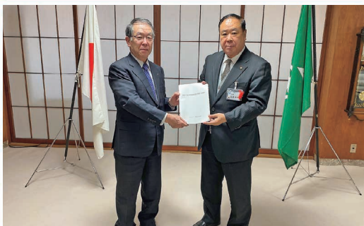
盛岡市長へ提言書提出