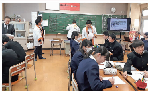
青年部会 租税教室