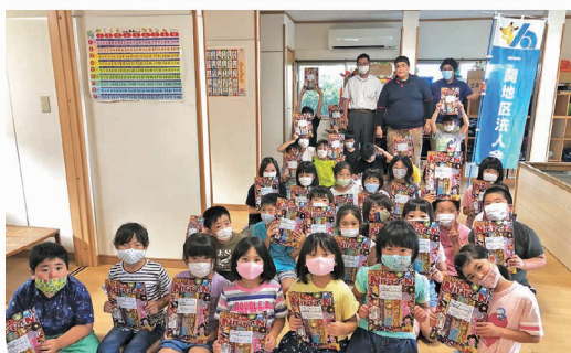
青年部会 小学校学童クラブ等へ手持ち花火を寄贈