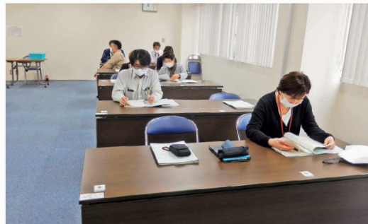
令和2年度 租税教室講師養成研修会