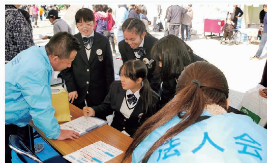
おもしろ税金クイズ開催