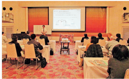
中小企業会計普及セミナーの様子