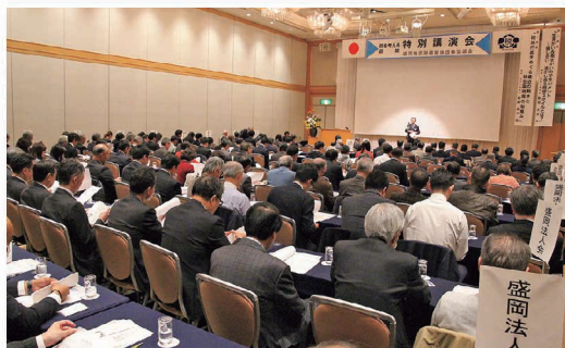
税を考える週間「特別講演会」