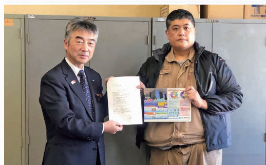
青年部会 教育委員会へ租税教育用下敷きを寄贈