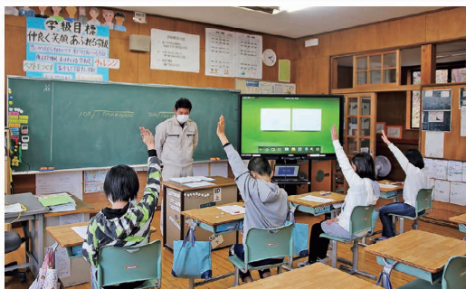
小学校への租税教室講師派遣