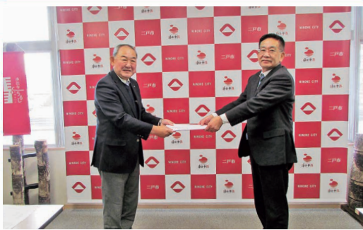
市長への税制改正要望提出