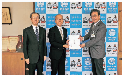
市長への税制改正要望