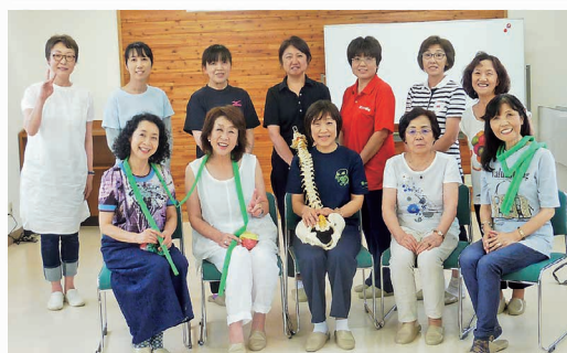
健康セミナーの開催