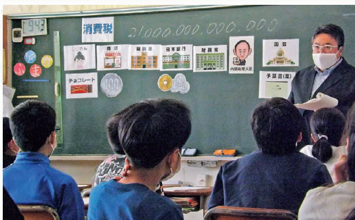
青年部会 租税教室の様子