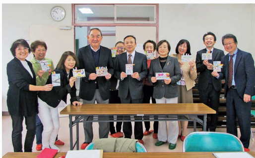
女性部会 税に関する絵はがきコンクール審査会の様子