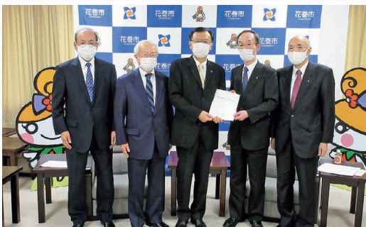
管内国会議員、市長、議会議長への提言書手交