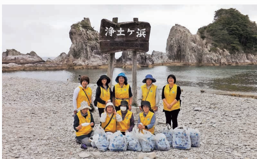
女性部会 観光地の美化活動